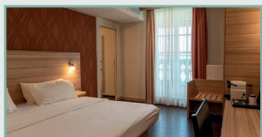
Beispiel Standardzimmer