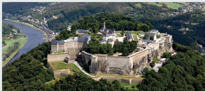
Festung Königstein